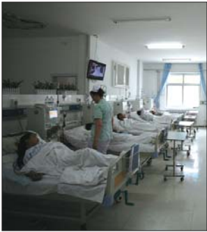
八十八医院肾内科血液透析室一角。

来。称体重、测血压、穿刺、上机、一小时测一次血压、下机、称体重等,十几个人一上午都没闲下来。中午12点,安排下午透析的病人也都到了,又是一番忙碌,等把所有病人顺利上机完毕,已经是下午2点了。 除了本院常规透析患者,春节期间还要接诊一些紧急透析患者。过年亲朋好友聚一块,一高兴,吃饭、喝水、吃药等方面都