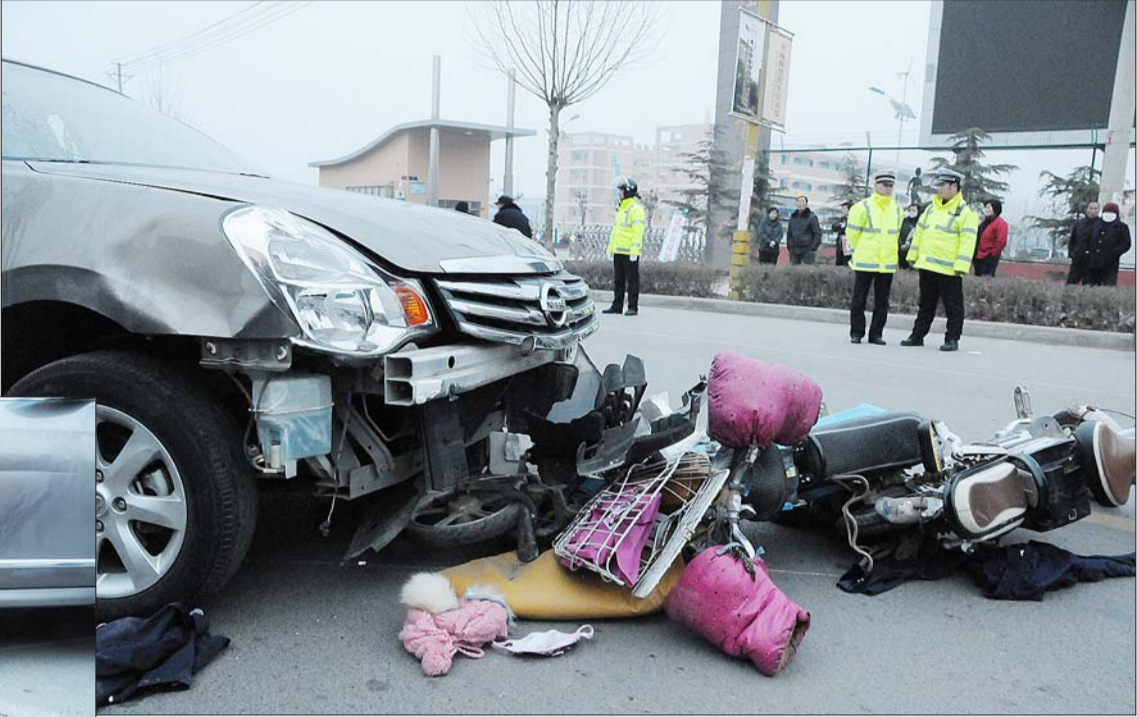
几辆电动车卷入车轮下。