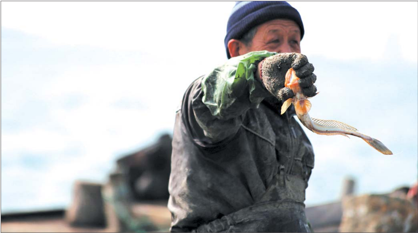
养马岛的小渔船出海一趟,也只能捕上三四斤鱼,只够自家尝个鲜。

记者调查发现,烟台梭鱼捕捞量减少,流入市场有限,目前市场上常见的大多是南方的养殖梭鱼。