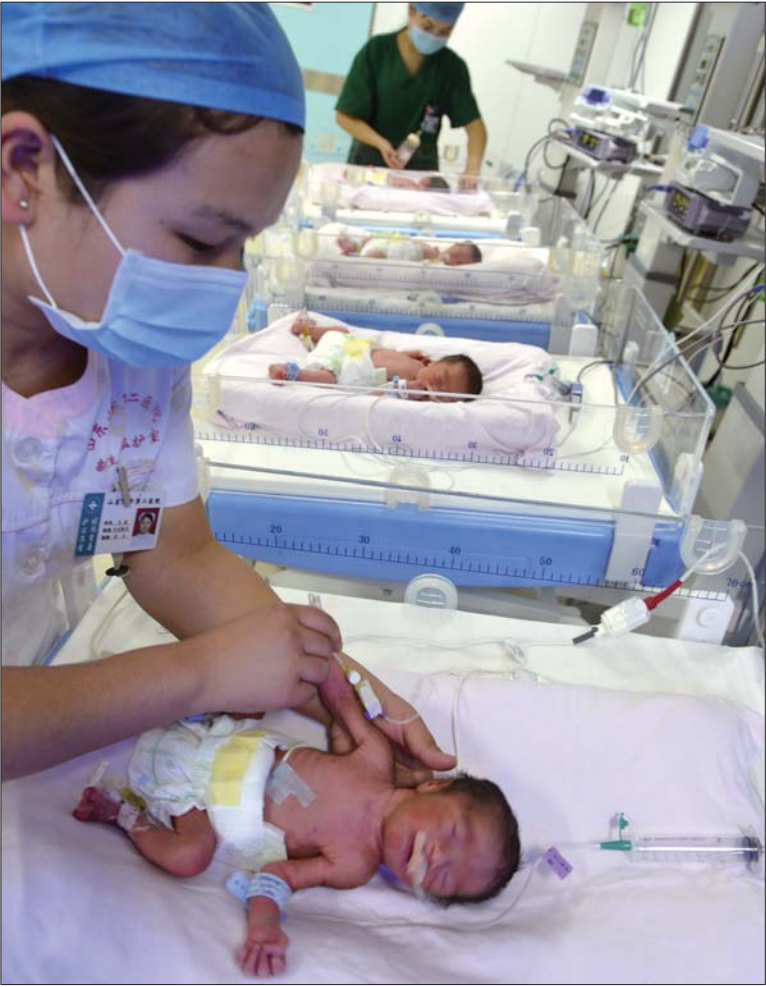
在山大二院新生儿监护病房,医护人员精心照料着四胞胎。