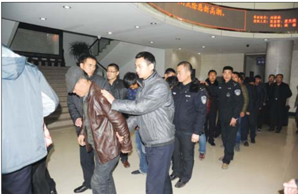
图为抓获的犯罪嫌疑人。

等工作分别定任务、定目标,并加强情况控制,每天调度、考核、排名。同时加大宣传舆论攻势,在镇街驻地、各村居、重点项目工地、公共场所悬挂标语横幅、张贴通告,实行举报有奖,发动广大群众参与打霸除恶百日集中行动中。 目前,全市共破获刑事案件367起,打掉霸恶团伙10个、黄赌毒团伙2个,抓获犯罪嫌疑人182名,其中刑事拘留犯罪嫌疑人168名,逮捕110名,追回各类逃犯143名,其中霸恶逃犯31名,行政拘留违法人员346名,严厉打击了违法犯罪分子的嚣张气焰。