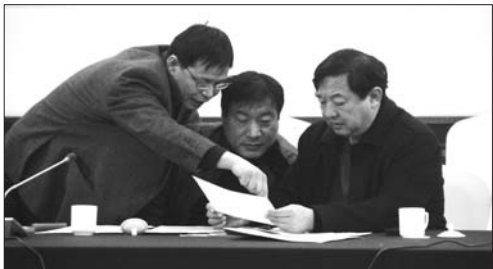
听证会参与者正在讨论调价方案。

时,现行标准收20.7元,方案一收20.3元,方案二收21.2元。从数据中可以看出,方案一乘坐时间越长越省钱,在里程数6公里及以内时,收费标准最高,7公里及更长里程时,运价比现行标准还便宜;方案二在6公里及以内时,高于现行标准,7公里至8公里时,低于现行标准,此后一直高于现行标准,且乘坐时间越长越不划算。造成价格变化的主要原因是调价方案将基价里程由6公里调整为8公里。因此,不少经营者在会上建议基价里程仍维持6公里。