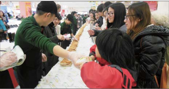
市民在排队领取三明治。