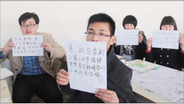
四位同学希望将“让座卡”推广到全校。

闫振旭说，看到座位被书本占着，后面来学习的同学有的就只好离开，也有的把座位上的书