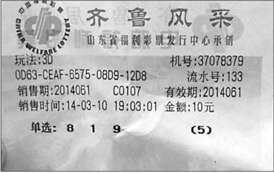
中奖彩票原件还在小杨手中。