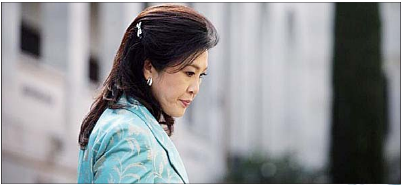
泰国看守政府总理英拉。

泰国宪法法院3月12日判决已获国会通过的一项2.2万亿泰铢(约合678亿美元)基础设施建设项目违宪,这意味着该项目的核心部分——中泰去年10月份达成的“高铁换大米”项目或将随之流产。