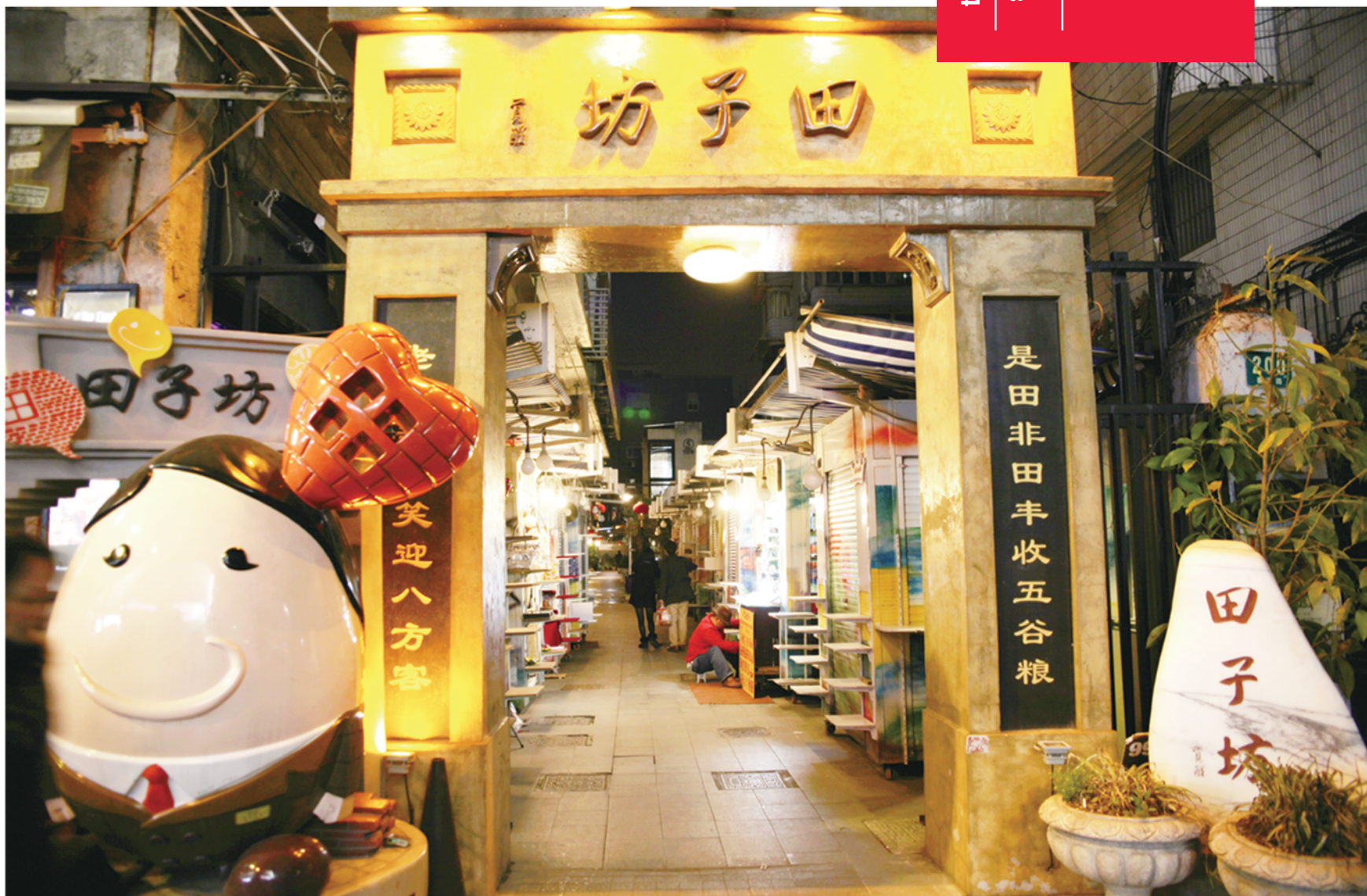
▲田子坊的每间咖啡屋都有独特的情调，细节的设计足以让游客沉浸其中。

城市就是一个高浓缩的旅游产品，在城市里，几乎所有资源都可以为旅游所利用。在城市内能否畅行无阻、能否找到新鲜生动的体验感、能否依靠无与伦比的配套留住过夜游客，这些都是考量一个城市是否真正能称得上“旅游城市”的标准。3月6日，省内重点城区旅游管理者赴上海和杭州两地，考察其在打造城市旅游中的先进做法，与此相比，我省城市旅游又有着怎样的差距，先进的样本是是否能够结合实际复制并创新呢？