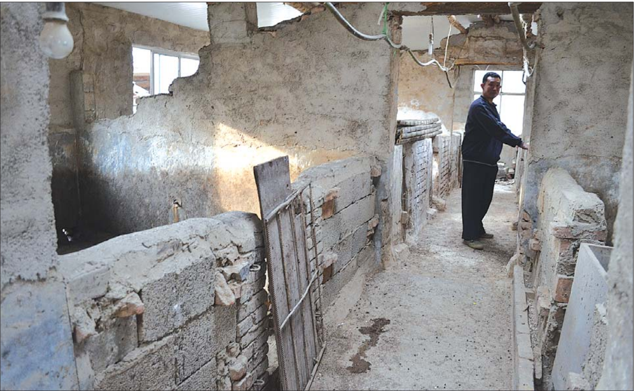
李庆荣家的猪圈空了。