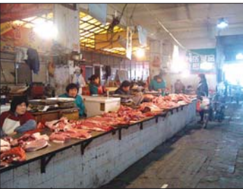
市场上的猪肉少人问津。

在大润发超市，猪肉同样打折销售，销售人员占先生说，“这个价格确实已经很低了，我在这里工作已经近两年，这价格是最低的一次。”占先生说，虽然价格低，但是来买的市民不多。“事实上猪肉涨价时候销量也好，跌价反而销量不好。”占先生说。