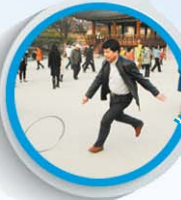
团员童心大发,玩起了儿时游戏。

4月13日,泰国“泼水节”开始;16日,鲁能客场挑战武里南“泰国亚冠助威团”即将启动