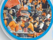
团员在现场为鲁能助威。