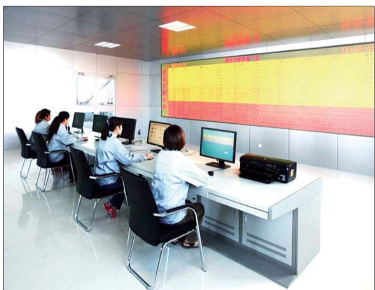
菱花新厂区的微生物发酵生产主控室。