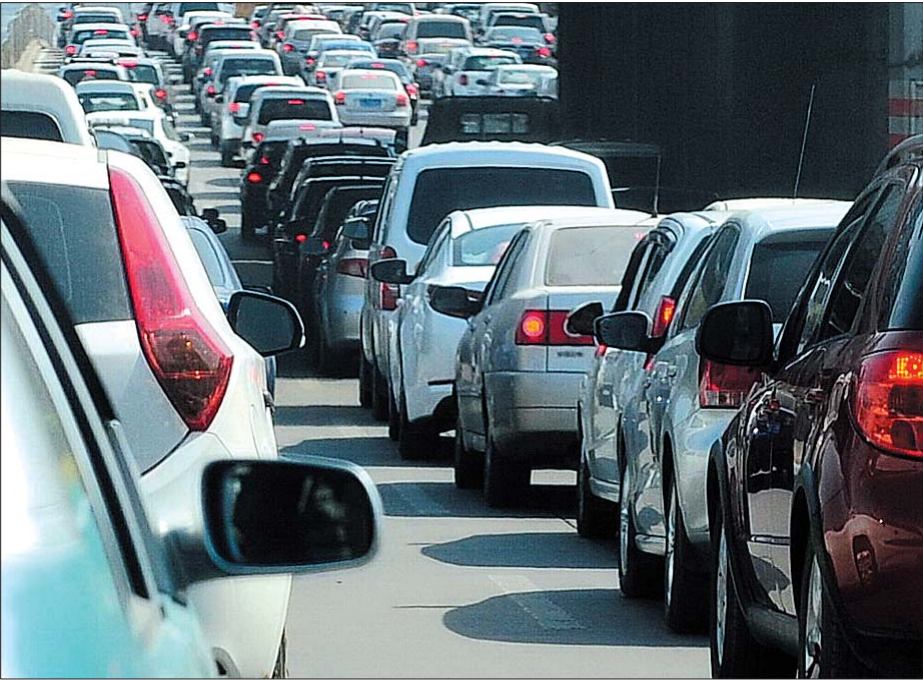
周末,通往南部山区及市区各个景点的道路严重堵车。

事实上，人满为患的不仅仅是南部山区。泉城公园和千佛山等景区也被前来赏花踏青的游客塞了个满满当当，以致周边的道路也出现了严重堵车。“进入泉城公园的入口都被车塞住了，一大批车辆没处停车。”市民周先生说。记者从泉城公园工作人员处了解到，仅23日一天游客就超过了6万