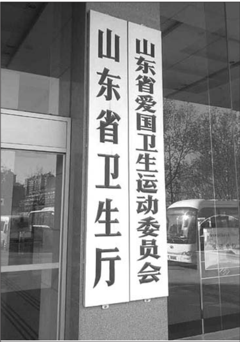
整合前的省卫生厅大门。

原省卫生厅行政编制数为108,原省计生委行政编制数为70,新组建的省卫计委行政编制比之前减少10个。