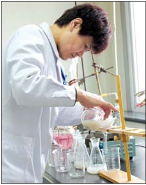
28日,济宁出入境检验检疫局工作人员为海鱼做检测。

28日上午11点,上官庆宾将海鱼的样品送到济宁出入境检验检疫局,为海鱼做重金属等六项指标的检测,预计31日就会出结果。