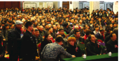
▲齐派真迹真迹武汉展吸引众多收藏迷观展

获悉,应齐由来自来先生要求,为让更多市民能够近距离鉴赏齐派真迹,满足更多书画迷、收藏迷的需求,本次巡展将面对全体市民开放。为保证巡展现场秩序,特开设巡展预约报名热线,请市民拨打0531-80951139 13335157317预约。