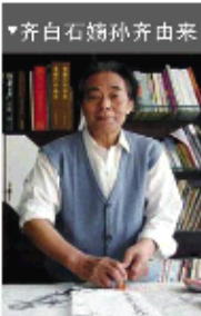
▼齐白石嫡孙齐由来自来