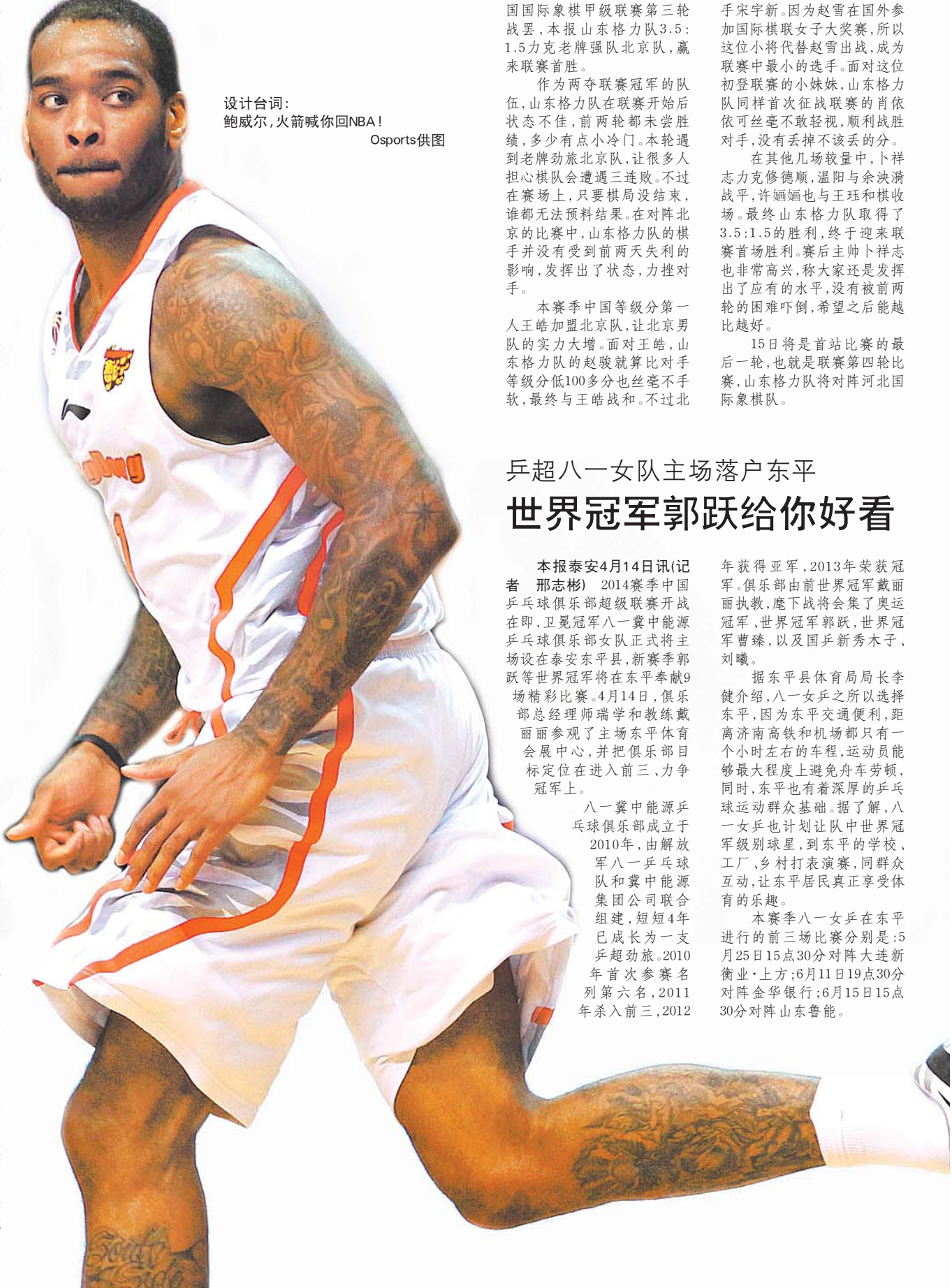
设计台词: 鲍威尔,火箭喊你回NBA!