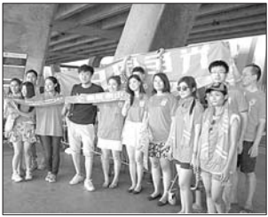
泰国的泰山助威团。