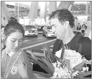
库卡给球迷签名。

记者从俱乐部了解到,包括本报的助威团在内,此次跟随泰山队到现场助威的国内球迷共有202人。另外,还有像小梁这样身在泰国的球迷60多人,将为泰山队加油打气。出门在外,泰山队并不孤独。