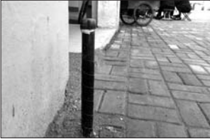
天然气管道已经通到了楼下,却一直没入户。

“今年6月1日前,让居民用上天然气。”济宁火炬房地产开发有限公司一位负责人介绍,因为入住率、资金等多方面的原因,未能给D、E两区的居民及时供上天然气,对此他们制定了相应的钱款补贴,目前正在积极处理解决此事,尽快让居民用上天然气。