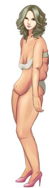
身材变形老化,影响整体形象和自信。