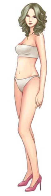
整体改变,拥有让人羡慕的精致身材。