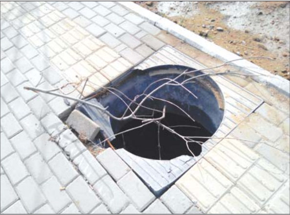
在盲道的一处井仅用树枝遮拦。

本报泰安4月14日讯(见习记者 闫克杭) 近日有市民反映,灵山大街迎胜路至长城路段近两千米的路程,有好多窖井没有盖。14日,记者到现场发现,这一路段12个窖井缺少井盖,另外损坏的井盖也有十多个。