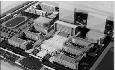
滨城区第八中学规划图,正在进行的一期工程为校门口右侧的楼房。