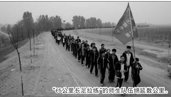
“65公里长足拉练”的师生队伍绵延数公里。

组口号,还有的小组为本次实践课程制定了队歌,准备了很多有趣的故事等,甚至学生们在出发前讨论并演练了多种突发状况的应急措施。学生们的这些准备完全是各自班级和学习自主组织,这不仅体现了学校自主管理的特色,更显示出了行知中学学生们的组织能力和团队意识。“我从教近30年了,个人从来没有尝试过65公里这么远的徒步拉练,更没有和学生们一起参加如此挑战性的拉练活动,学校给我们老师这样一个机会去和学生们一起挑战自己,打造班级互相激励,相亲相爱的家庭式亲情关系,我觉得这将是我和学生们人生中重要的一课。我相信