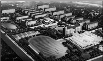
二中一期工程的2号和3号教学楼为图上右上角的两栋。