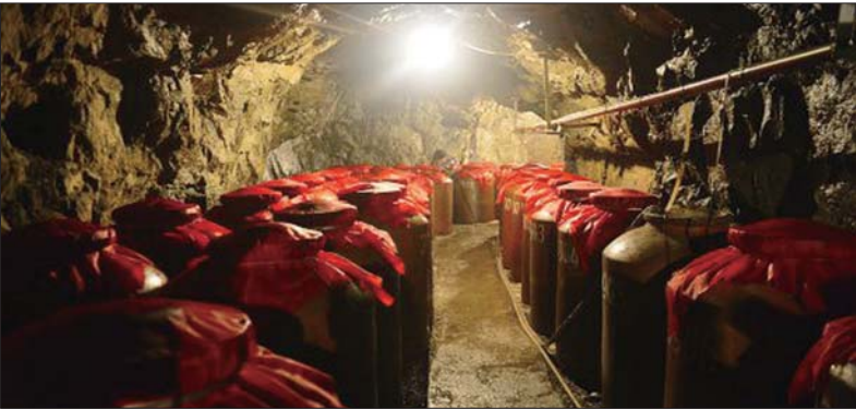
▲天地缘酒业洞藏基地。

明诚信民营企业”,“全国第七届创业之星”,省级“守合同重信用企业”,“中国专利山东明星企业”等多种荣誉称号。08年帝豪酒业进入“山东百强民营企业”。公司将一如既往保持企业良好的发展势头,以优良的商业信誉,先进的营销理念和灵活系统的销售网络在市场竞争中再创辉煌。