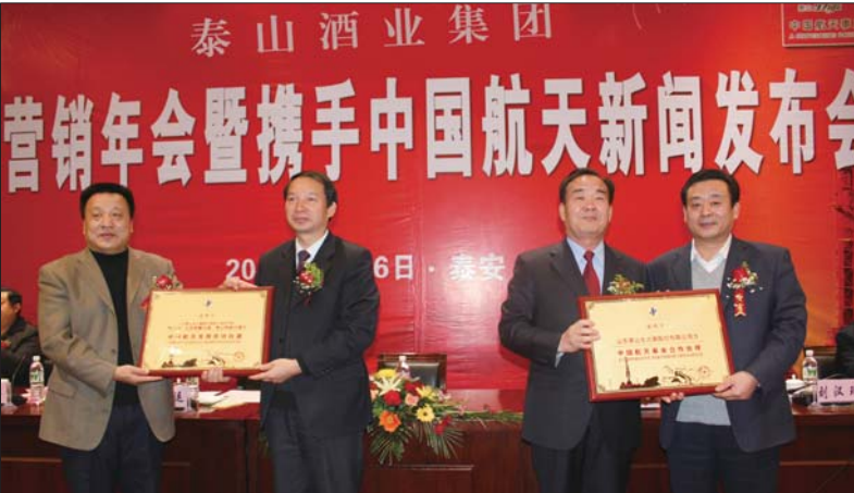
▲中国航天基金会为泰山酒业授牌

质量,使花冠白酒的各项理化指标均达到或超过国家标准。为确保产品质量,花冠集团始终坚持原酒储存结构与产品结构、市场结构相匹配,不断加大投资,扩大原酒生产规模与储酒能力,拥有粮酒发酵池6000个,储存能力4.7万吨,保证了市场需求与质量需求。 人贵品质,酒凭质量,花冠集团十几年如一日始终坚持“实实在在做人,认认真真酿酒”的经营理念,用真心酿造的美酒奉献给每位消费者。