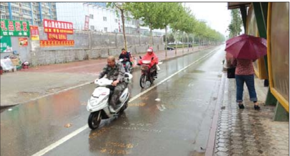
市民在雨中疾行。

本报泰安4月21日讯(记者 路伟) 21日中午,一场春雨光顾泰安,为干燥的城市“解渴”。泰安市气象台预计,今天局地仍有降雨,本周五和周六,或迎更大降雨天气。