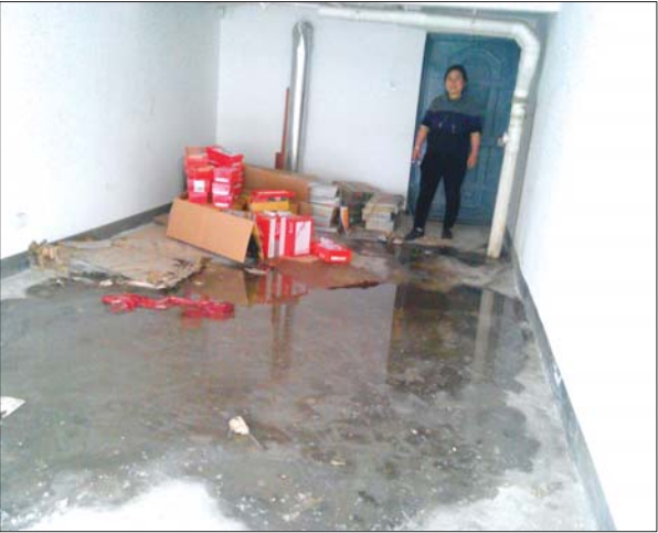
存放皮鞋的车库里有大片积水。

本报泰安4月21日讯(见习记者 闫克杭 许富之) 3月初,华城丽景湾住户李女士发现,地下车库下水管道漏水,里面存放的70多双皮鞋受损,损失近9000元。物业称应由楼上六户业主赔偿。 4月21日,在李女士存放皮鞋的地下车库中间有一滩污水,污水北边有两箱皮鞋,另有十几双放在旁边。离污水较近