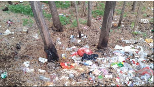
其中部分被烧毁的柳树。

本报泰安4月21日讯(见习记者 刘真) 近日,有市民拨打本报热线反映,东岳大街岱银集团对面绿化小树林中,有多棵柳树底部烧毁,周围丢弃着许多未焚烧完的生活垃圾。 21日,在岱银集团对面绿化树林里,有10多棵柳树底部被烧黑,并且已经枯萎,柳树旁有许多未焚烧完的生活垃圾。“我下班路过这里,发现这些柳树底部发黑,走近一看,原来是有人在这里焚烧垃圾,把旁边的柳树也给烧毁了,柳树已经生长很多年,看着很可惜,希望市民都能保护这些植