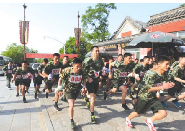
打下良好基础。最终岱岳区大队、泰山区大队、高新区大队分别包揽了大队团体总分前三名。

据了解,登山比赛自1992年至今已成功举行22届,通过举行比赛,进一步陶冶官兵情操,增强官兵体质,丰富官兵业余文化生活,为今后担任繁重的消防工作