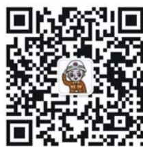
泰安消防官方微信