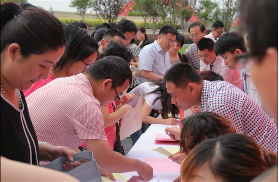
签到处签到的市民