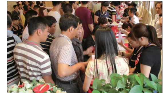
签约大厅人头涌动