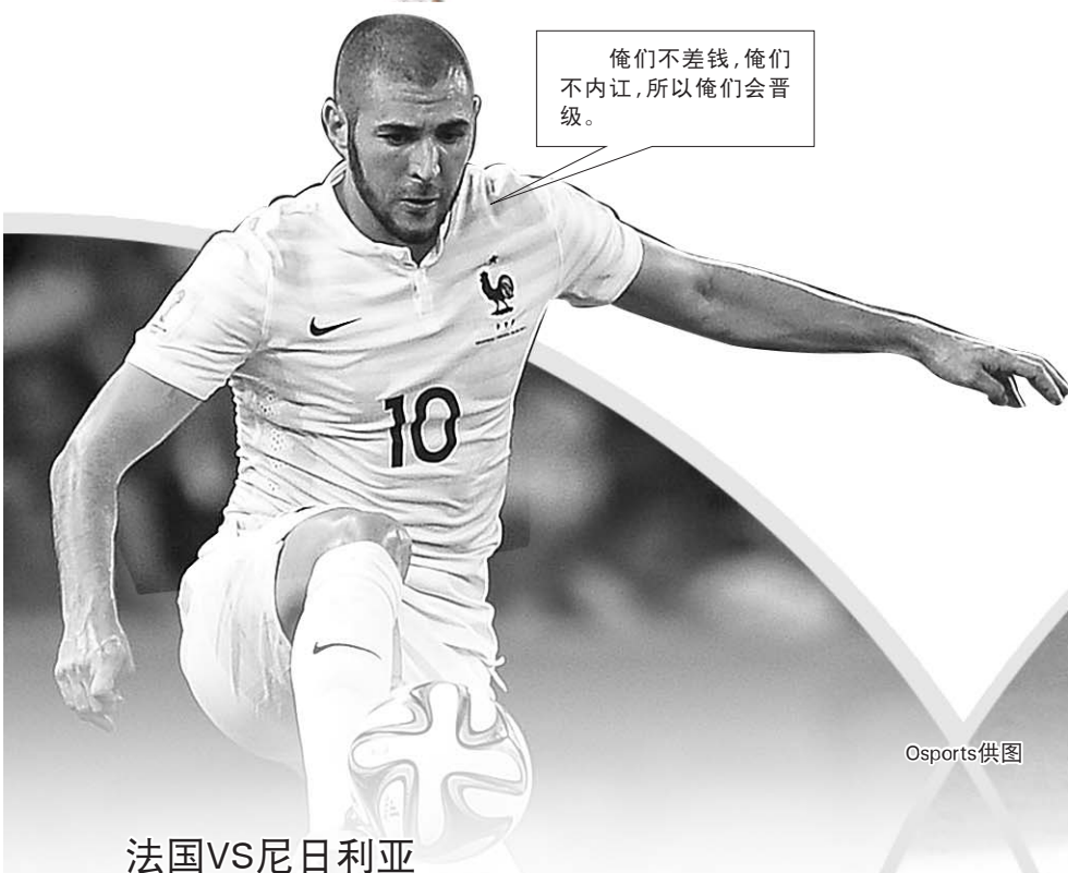
法国VS尼日利亚 北京时间7月1日0:00