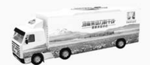
左边车身效果(牧场)

安利首创的“纽崔莱动力新干线”健康快车将于7月3日再次登陆聊城,市民可持测试券参加健康测试和接受专业营养咨询,活动现场还设有产品体验等环节。活动地点开发区国际会展中心时间将持续到7月8日。