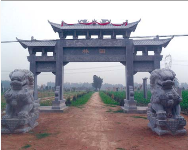
巨野县田庄镇田状元林门的牌坊。

七十年代该状元林遭到严重破坏。坟墓被夷为平地,墓碑被推倒,用作村里建戏院的地基。2000年戏院被拆除,其族人将部分石碑集中立于状元墓前。现在墓地有清代至民国时期的功德碑及墓碑19通。碑刻高2.95米至2.25米不等。其中有李鸿章、徐世昌提名牌各一通。另有其他高官大臣,为田在田本人、夫人及家族的拜题、拜表。碑碣数量之众,规格之高,做工之精良,书法之隽永,人物地位之显赫,文章之精辟独到,为鲁西南所罕见,具有很高的历史研究和艺术欣赏价值。2013年10月,田状元林被列为山东省文物保护单位。2014年春,田氏家族成立了状元林保护管理委员会,除立牌坊外,还积极搜集遗失的有关碑文和状元遗物,传承状元文化。