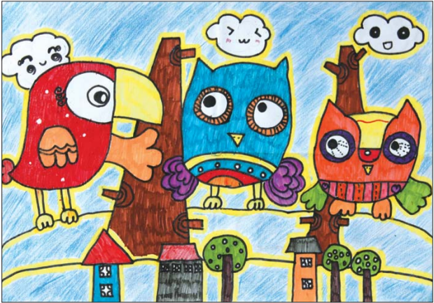
任紫航 10岁 滨州经济开发区中海小学 《可爱的猫头鹰》

料”的道理。我认为以得奖和价钱高玩品鉴收藏的人是没有文化的,企业家娶港姐女模为妻或农民财主专买价格最高的奢侈品一样是没眼光没品味一种表现,所以我不是十分关心市场的问题。 李广平,1963年出生,平原县人。1987年毕业于曲阜师范大学美术系,并留校任教,逐年任职美术学院副教授、硕士生导师、副院长。现为齐鲁师范学院美术学院院长。1990年进修于中央美术学院国画系人物画室,2004年结业于中国艺术研究院第三届中国画名家班。2013最受山东书画市场欢迎与关注的中国画名家中,与常朝辉等16人共获最具升值潜力奖。