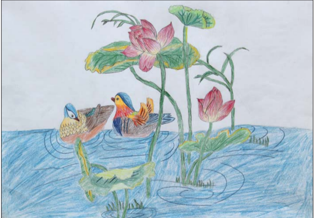
马子昕 9岁 京博希望小学 《鸳鸯荷花》