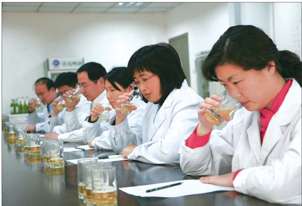
青岛啤酒品评师们用嘴为消费者畅饮把关。

哪款酒口味有异常、苦味偏大还是偏小,都要经过专业品酒师的逐一品评,给出意见,然后进行改进。品酒师不仅要品啤酒,还包括对原材料、包装物料、成品、半成品以及和酒液相接触的物料等的品评,甚至连瓶盖水、瓶盖中小小的垫片的“煮沸水”也要