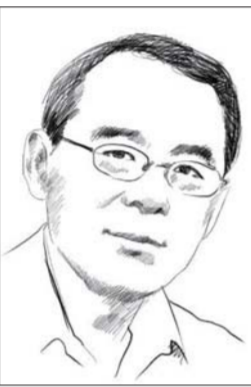
刘仰,字仰之,文化评论人。2008年与宋晓军、王小东、黄纪苏、宋强一起出版《中国不高兴》。

虽然因为更新鲜、更劲爆话题的接连出现,常有新话题暂时取代了食品安全话题的头条热度,但食品安全话题显然会是一个长期的话题,因此,再写点我的看法。