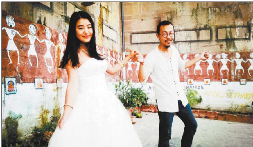
▲在印度教圣城瓦格纳西拍婚纱照实在艰难,遭到惨无人道的围观、不停被拉着合影。