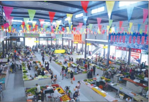
经过整治后的铁西农贸市场。

“扫障”只是第一步,“服务”才是能否引得凤来栖的关键。为营造良好的经济发展环境,邹城不断深化行政审批制度改革,先后压减行政审批事项、收费项目135项,暂停、取消行政许可事项44项,向园区和镇街下放审批和收费项目66项;对18个部门,6大类、3个重点领域集中开展中介组织大清理活动,全面规范了市场中介组织的执业行为;通过完善和创新户籍、交通、消防等各项管理和审批服务方式,提高服务效率、质量和水平。如今,企业在邹城投资不仅不用为“外来骚扰”而闹心,更因享受优质的“内部服务”让创业变得更加舒心。