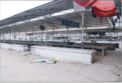
整治前的铁西农贸市场。

执法。城管部门对流动摊点、探头经营商户进行清理疏导,市政部门在校门口东西两侧的人行道上围起护栏,铺上花砖,规划成接送等待区,家长们接送学生井然有序;每天早上交警部门还会安排专人在附近路口疏导交通,更有特勤人员在学校附近巡逻,确保学生安全。 此外,该市文化市场综合执法局还联合工商、公安、文广新等部门开展“净网行动”,对学校周边的网吧进行整治,依法取缔黑网吧,校园周边环境大大改善。