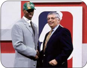
比卢普斯的职业生涯也有许多高光时刻。