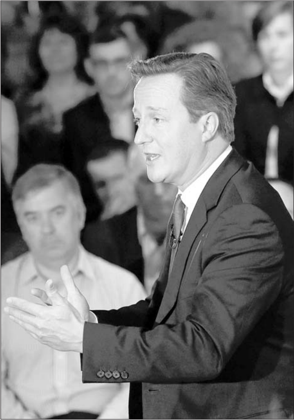
9月10日，在爱丁堡，卡梅伦发表讲话。