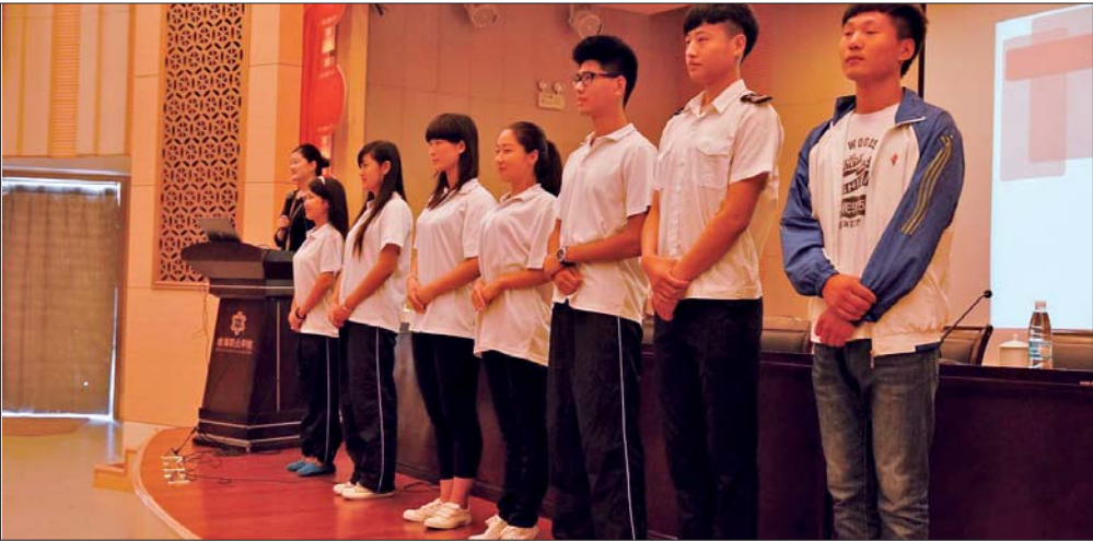
▲铁三志愿者接受礼仪培训。