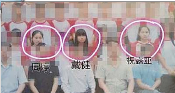
三人是高中好友。

本报与三湘都市报联合寻找两名女生,如果您有线索,可拨打本报热线96706,或直接与齐鲁工业大学、长清区大学路派出所联系。