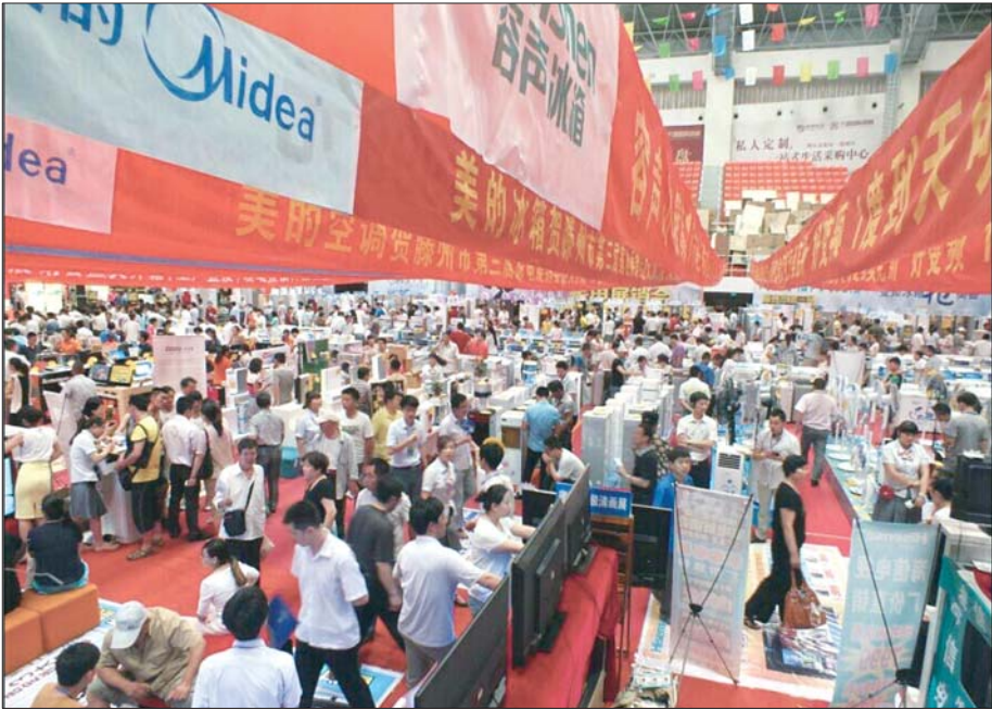
本周六,济宁首届家电博览会将盛大开幕。

本报济宁10月26日讯(记者 于伟) 11月1日,新体育馆东广场,济宁市首届家电博览会将盛大开幕。厂家直销,惊爆低价,万元大奖免费抽,更有六重大礼回馈济宁市民。上百个家电品牌,近千种家电产品,一站式购物让你“满载而归”。 如果你想购买家用电器,本周六,不妨到济宁首届家电博览会上转一转。11月1日-2日,济宁首届家电博览会将盛大开幕,家电市场再现盛宴。家电行业的一流品牌系数参展,格力、美的、海尔、海信、TCL、创维、康佳、小天鹅、容声、新飞、西门子、三星……展品范围覆盖电视、空调、冰箱、洗衣机、热水器、小家电、厨房及浴室家电、电脑、手机、数码等。 本届家电博览会由天安家电独家冠名。为回馈济宁父老乡亲,天安家电特准备六重大礼。活动当天,天安家电各大家电品牌总裁助阵,厂家直销,惊爆低价,狂降特卖两天;对开门冰箱、50寸液晶电视等大奖疯狂抽不停,更有2次中奖机会;来就送,买更送,来即送精美礼品,购家电更有豪华礼品;指定家电产品限时抢购,5折起售;预交10元购买入场券,当100元用;并有抽奖券相赠;活动当天,更有星光大道“草帽姐”鼎力助阵,倾情献唱,与你零距离互动。 除特价商品限时不限量,参展厂商也携带着自主创新、节能减排、环保的家电产品空前展示,另有新品集中借势首发,这些产品覆盖面齐全,产业链完整,既有最新款式的冰箱、空调、洗衣机产品,也有国际知名品牌凝聚心血、精心打造的高端精品。届时,最前沿的产品、最先进的科技、最时尚的设计、最环保的理念也将集中出现在本次展会上。 更多的买赠活动、低价促销,更多高端新品、科技新品,尽在济宁首届家电博览会。买电器,不必东奔西走,考虑良久,济宁首届家电博览会,一应俱全,11月1日-2日,新体育馆东广场,等你前来。