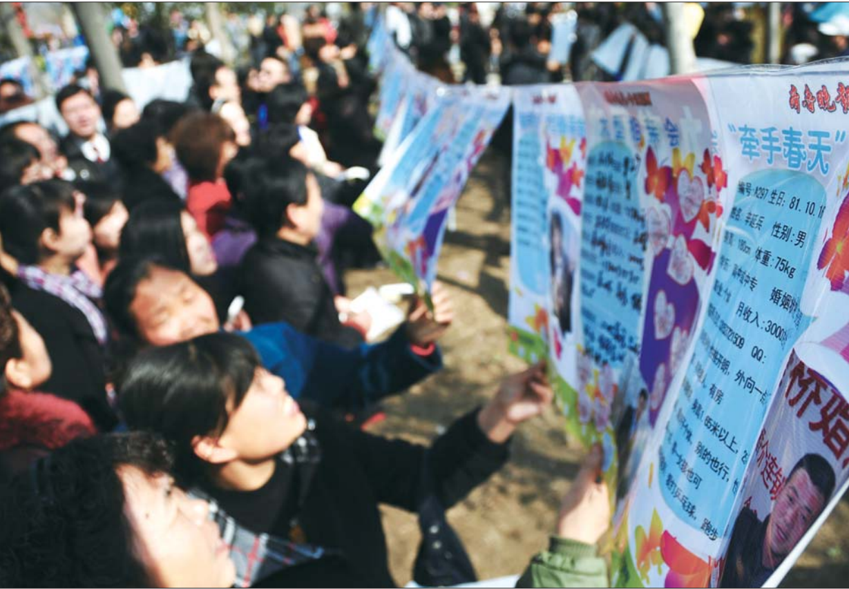
相亲会的火爆场面。(资料图)

本报济宁10月26日讯(记者 孔令茹) 进入10月,满地黄色的落叶在提醒你,浪漫的秋天来了。在这样一个浪漫和收获的季节,怎能让爱情缺席?为了让大家在秋天收获一份甜蜜的爱情,本报联合翠都国际广场、昂天传媒共同举办“情满金秋,爱在翠都”秋季大型相亲会,即日起单身朋友们就可以免费报名啦! 也许你还在单身,而导致你单身的理由有很多:工作忙、圈子小、生活太过规律、经济基础还不够稳定……但所有的理