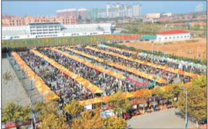
►招聘会现场,人气爆棚。