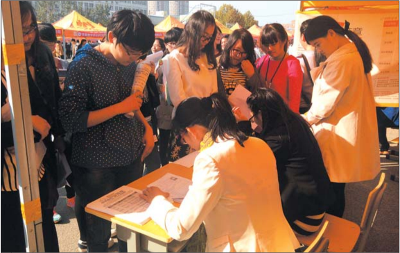
▲一些热门岗位前挤满了应聘的毕业生。

“电子商务企业需求量也很大。”祝元生说,“舒朗服装公司一下子就跟我们要2000名电子商务专业的毕业生,但目前学校该专业只有不足百名毕业生,根本满足不了。”