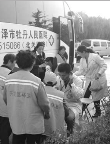
义诊现场。

站附近,菏泽市牡丹人民医院的医生们又开始了免费体检活动,“昨天听说这里有义诊活动,扫完负责的路段就过来看看,顺便做个检查。”不少环卫工人笑着说。 记者了解到,环卫工人们平时每天早上4点钟起床,清扫完一遍街道后回家吃早饭,从早上8点工作到12点,下午1点工作到6点。一般环卫工人的工作清洁道路有四百米左右,有的人要负责道路两边的非机动车道,像长江路这种道路中间有隔离栏的道路清理起来难度更大。 在体检中,记者发现前来体检的环卫工人们年龄普遍偏大,“在检查中,环卫工人们比较常见的症状就是高血压。”参加本次体检的医生告诉记者。