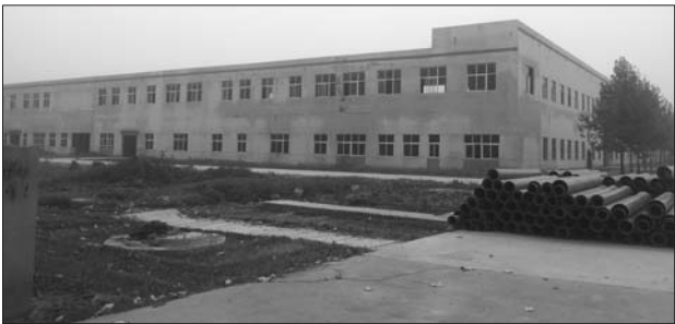
媒体曾报道富士康暂定厂址的原三利纺织厂。

核心提示:菏泽市政府与富士康长达两年的谈判博弈,历经十多轮的考察调研,以及分分合合的各种传言,终于在10月25日这天尘埃落定。菏泽市委副书记、市长孙爱军代表市政府与富士康方面签约。富士康菏泽产业园项目,主要从事电子及相关产品生产、研发与销售。本报将推出系列报道,展现这场“大联姻”的婚后生活。