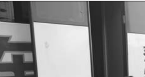
环卫工人正在接受体检

站附近,菏泽市牡丹人民医院的医生们又开始了免费体检活动,“昨天听说这里有义诊活动,扫完负责的路段就过来看看,顺便做个检查。”不少环卫工人笑着说。