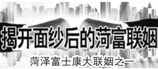
揭开面纱后的菏泽富士康