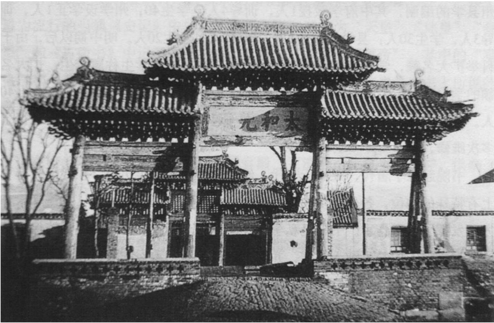
棣州文庙太和元气坊。