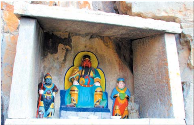
非常罕见的关公石龛。

水母奶奶山上的石雕造像颇为珍贵，对了解当地的风土人情很有考究价值，已被长清区人民政府列为重点文物保护单位。