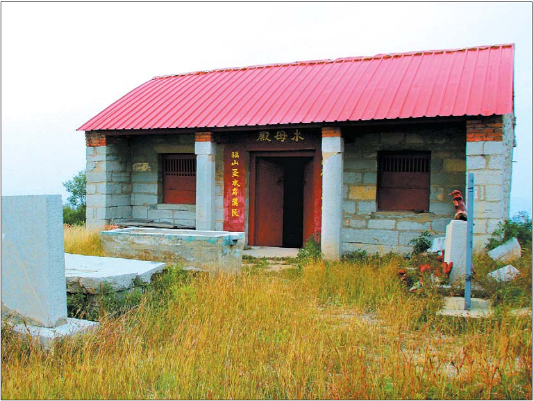
位于水母奶奶山顶的水母殿。