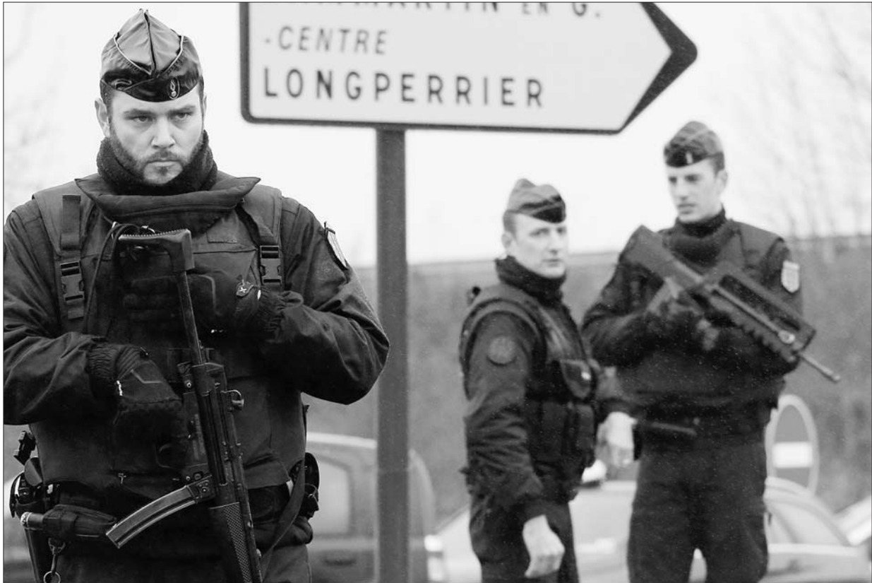
9日,在法国达马尔坦昂戈埃勒,警方人员在劫持人质事件现场附近检查车辆。