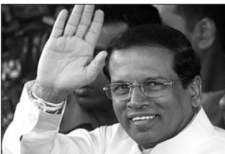
9日,斯里兰卡新当选总统西里塞纳挥手致意。

本报讯 斯里兰卡选举委员会9日宣布,反对党共同候选人西里塞纳赢得总统选举,当选新总统。现任总统拉贾帕克萨当天承认败选,并承诺将与西里塞纳进行和平权力移交。去年11月20日,当拉贾帕克萨决定提前两年举行总统大选时,他被普遍认为能顺利再次连任。但随着身为卫生部长、执政党自由党总书记的西里塞纳与执政党决裂并出任反对派共同推荐的候选人,竞选形势急转直下。