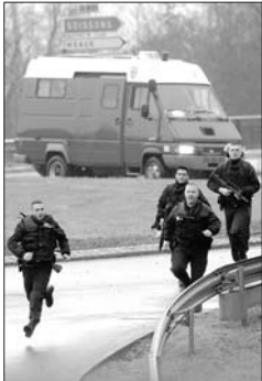
9日,在法国达马尔坦昂戈埃勒,警察抵达劫持人质现场。

在对峙一段时间后,法国宪兵特种部队向袭击《沙尔利周刊》总部的2名嫌疑人发起进攻。枪声和爆炸声持续了20秒,2名嫌疑人已被击毙,人质获救。截至北京时间10日凌晨1时30分,本报特约记者黄冠杰从巴黎发回的消息称,在巴黎东部万塞讷门人质劫持案现场,警方也向劫持者发起进攻,2名劫匪被击毙,3名人质被杀害,5名人质被解救。