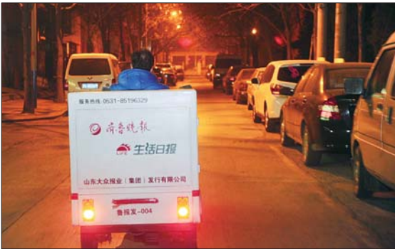
城市还在沉睡中,高波已经披着灯光上路了。