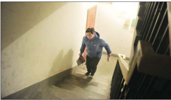
爬楼、下楼、再爬楼……用高波的话说就是当“晨练”了。