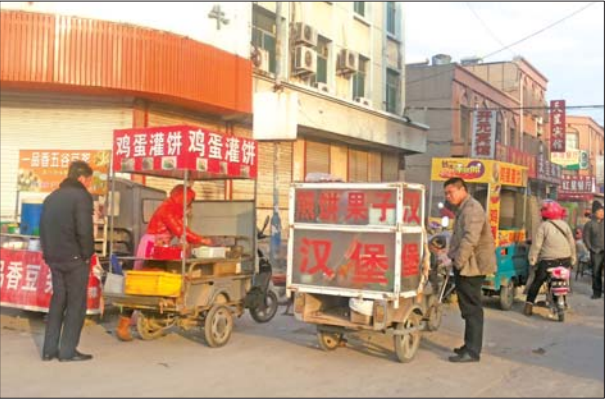
流动摊点设施简单，卫生条件令人担忧。

洗手、去完洗手间是否洗手，市民都无从知晓。且流动摊点供应的豆浆等定型包装食品均属“三无”产品，无厂名、无厂址、无生产日期和保质期。