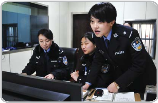
认真查看监控录像。