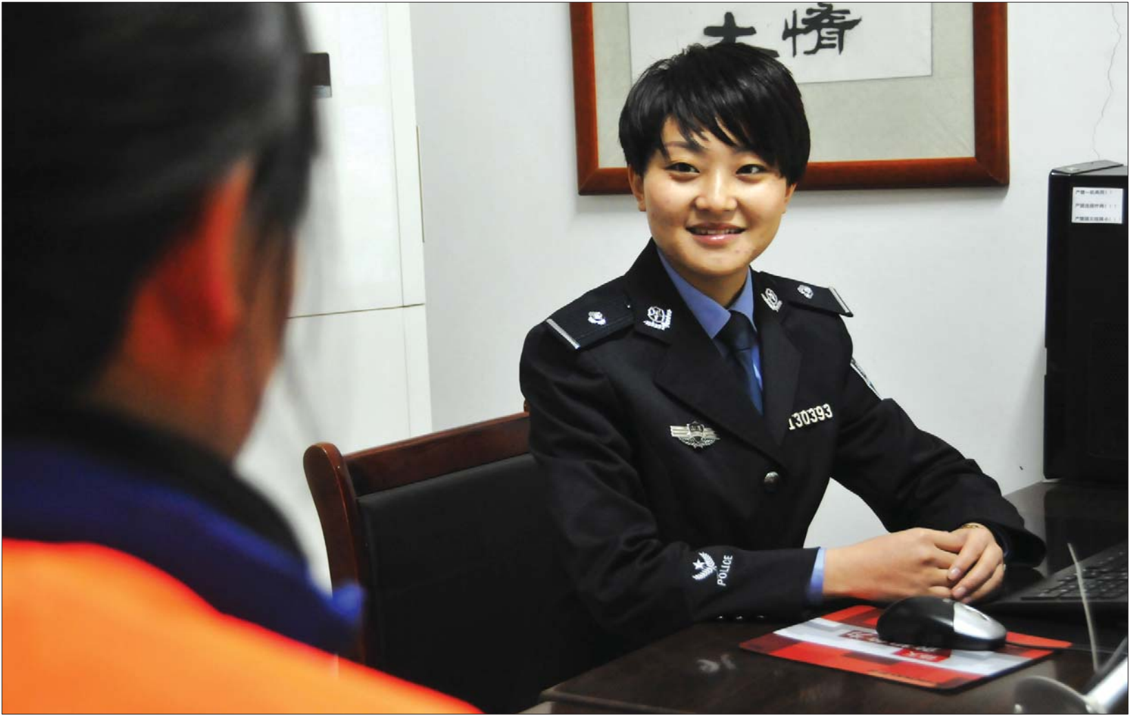
执勤女警对在押人员进行心理疏导。