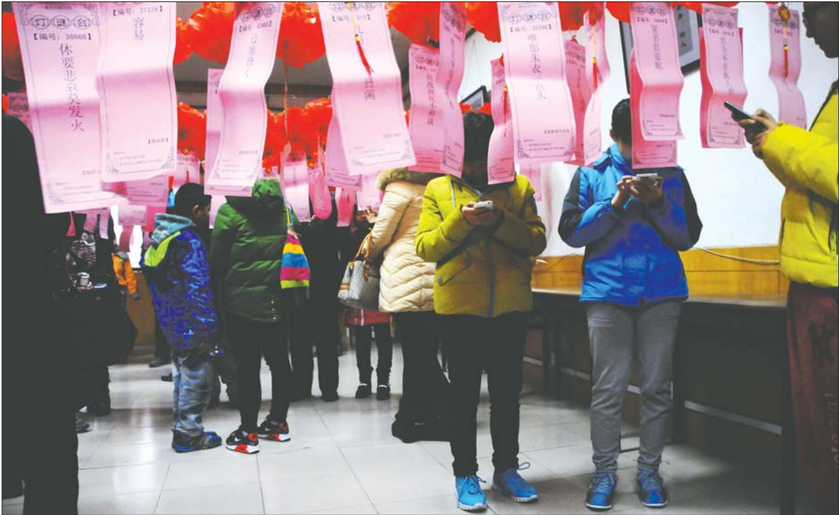
3月5日,在猜灯谜活动现场,不少人专注手机搜灯谜。

本报3月5日讯(记者 李榕) 庆祝元宵节最传统的形式莫过于赏花灯猜灯谜了。3月5日,德州市图书馆的老馆和新城分馆同步举行灯谜会,热闹而充满趣味的活动引来众多市民参与,但记者发现,不少年轻人懒得动脑筋,直接拿出手机搜索谜底,换取小礼品,“元宵节不是猜灯谜,成了搜灯谜了。”市民孙先生戏称。