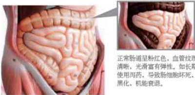
图3:“粉红结肠”与“黑变结肠”对比图