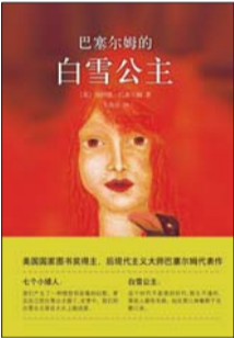
北京师范大学出版社 唐纳德·巴塞爾姆 著 《白雪公主》

美丽善良的辛德瑞拉都不爱了?拜托,这可是历史上自带主角光环魅力值最高的正能量人物啊。本周,在融融春色里涌进电影院观看新版《灰姑娘》的观众们,目光却被阴冷的坏继母吸引。联想之前根据经典童话《睡美人》改编的《沉睡魔咒》,原本故事中的小睡美人干脆就是个和暗黑魔女搭戏的配角。曾经给我们带来美好回忆的童话,为什么会变成如今反派当道的样子?