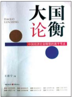
《大国论衡》 王佳宁 著 重庆出版社 2015 年 2 月出版

《大国论衡》评点新中国成立至今的 65 年。大家知道,这 65 年改革开放前 29 年和改革开放后 30 多年两个历史时期,这两个时期在社会主义建设的指导思想、方针政策上有着重大区别,但佳宁以历史唯